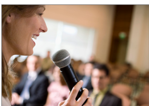
Spreekgestoelten en seminars