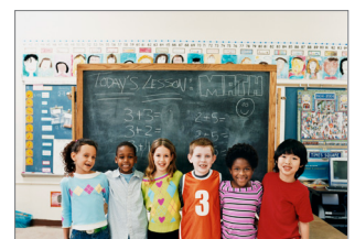
Onderwijs: scholen en universiteiten